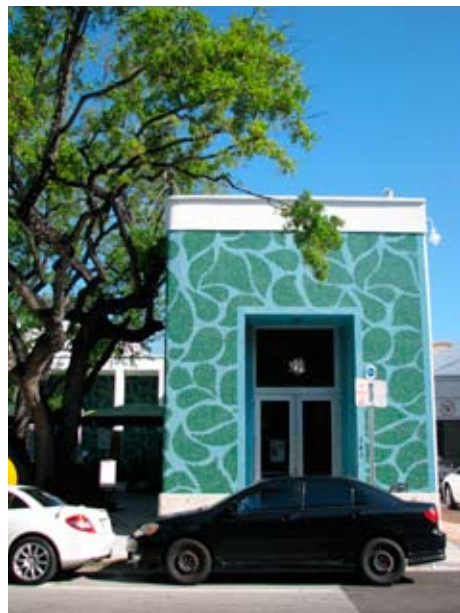
Le quartier du Design District.