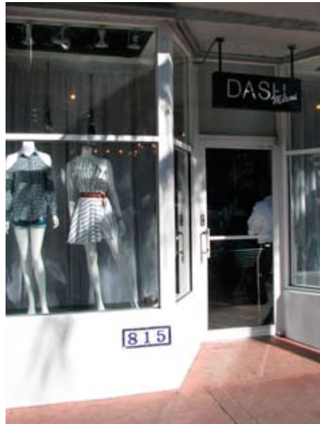
Dash, la boutique des sœurs Kardashian.