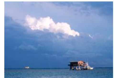
Les maisons sur pilotis de Stiltsville.

gadgets à l'effigie de Kim, Khloe and «Ko». On aime... ou pas.