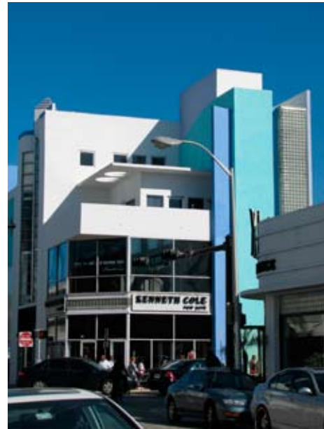
Entre Collins Avenue.

Enfin, on ne peut déceimment pas se pointer à Miami sans aller exhiber son bikini dernier cri au bord de l'océan. La plage du Delano Hotel est ultraclasses, avec ses transats moelleux et son service cinq étoiles. Et pour fuir un peu le bling, arrêtez-vous au Standard Hotel. La piscine et ses alentours verts et zen sont un havre de paix, alors que le restaurant-terrace est un vrai bijou.