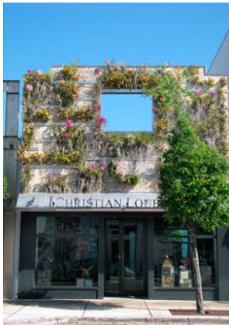
La boutique Louboutin et sa façade végétale.