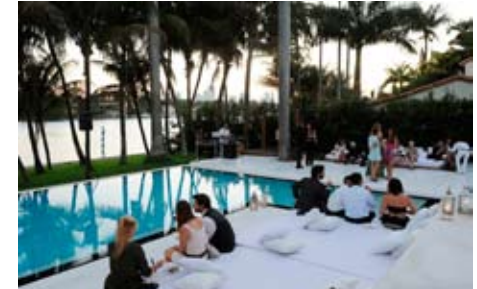
Une soirée bling sur l'île de Hibiscus Island.

les marches de la fameuse maison de feu Gianni Versace, devant laquelle il fut assassiné. C'est dans ce quartier qu'on peut voir cette architecture typiquement Art déco, aux couleurs pastel qui fait aussi la renommée de la ville. C'est d'ailleurs dans l'un de ces immeubles historiques que se trouve The Webster, temple de la fringue au top. Ce concept store ultramode se situe à deux enjambées de Dash, la boutique des sœurs les plus bimbos-stéréotypées des USA, les Kardashians. Le lieu est surtout recommandé aux fervents admirateurs des reality shows de MTV qui rêvent de croiser les belles. On y déniche des maillots de bain, deux ou trois robes de créateurs et surtout plein de