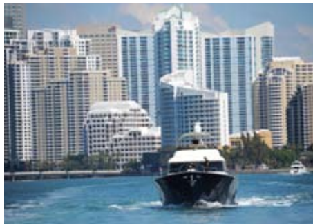
Miami Beach vue de l'océan.

Départ pour la Floride à l'occasion du lancement d'un nouveau champagne, le Moët Ice Imperial. Visite d'une ville sea, frime and sun. Par Anaïs Thévoz