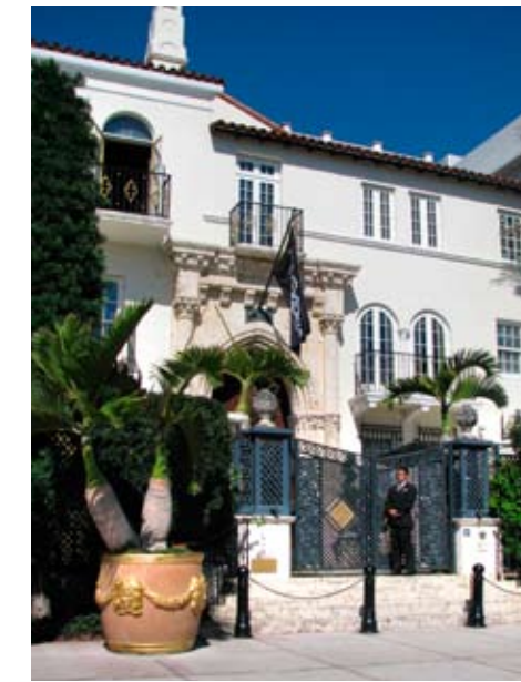
La maison de Gianni Versace.