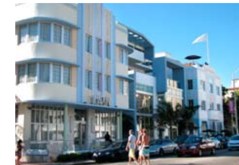
Les immeubles Art déco de Miami Beach.