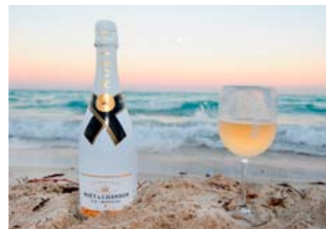
Le nouveau Moët Ice Imperial, à boire glacé et au bord de l'eau!